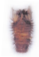
ヒメマルカツオブシムシ